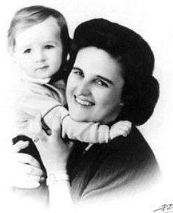
sv. Gianna Bernadett Molle patrónka konferencie