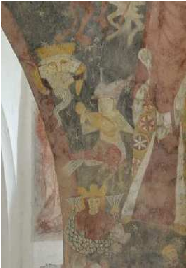
Detail fresky z kostola sv. Margity Antiochijskej. - Fresco detail from the church of St. Margaret of Antioch.