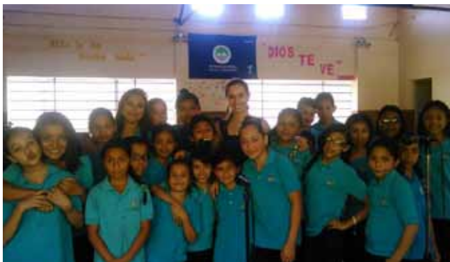
Škola Oratorio Don Bosco