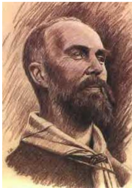
Otec Jacques Sevin

Jezuita Jacques Sevin vyvinul na základe skautskej metódy pedagogiku založenú na evanjeliových hodnotách. Jej cieľom je podporiť rozvoj a rast mladých. Mladý človek je nabádaný k tomu, aby rozvíjal svoju osobnosť a talenty, ktoré do neho vložil Boh.