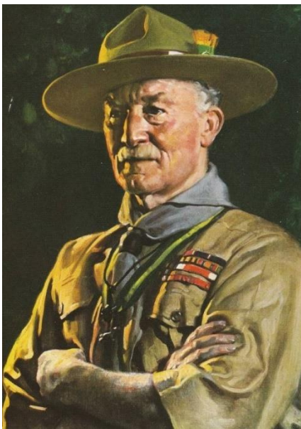
Lord Robert Baden-Powell

Cieľom skautingu alebo skautského hnutia je prispieť k rozvoju fyzického, intelektuálneho, sociálneho a duchovného potenciálu osobnosti mladých, aby sa stali zodpovednými občanmi a členmi lokálnej, národnej a medzinárodnej komunity. Skautské aktivity sú odvodené od výcviku vojenských prieskumníkov (skautov), ktoré lord Robert Baden-Powell vo svojej knihe Skauting pre chlapcov upravil pre potreby chlapčenských hier. Čoskoro sa k hnutiu pridali aj dievčatá.