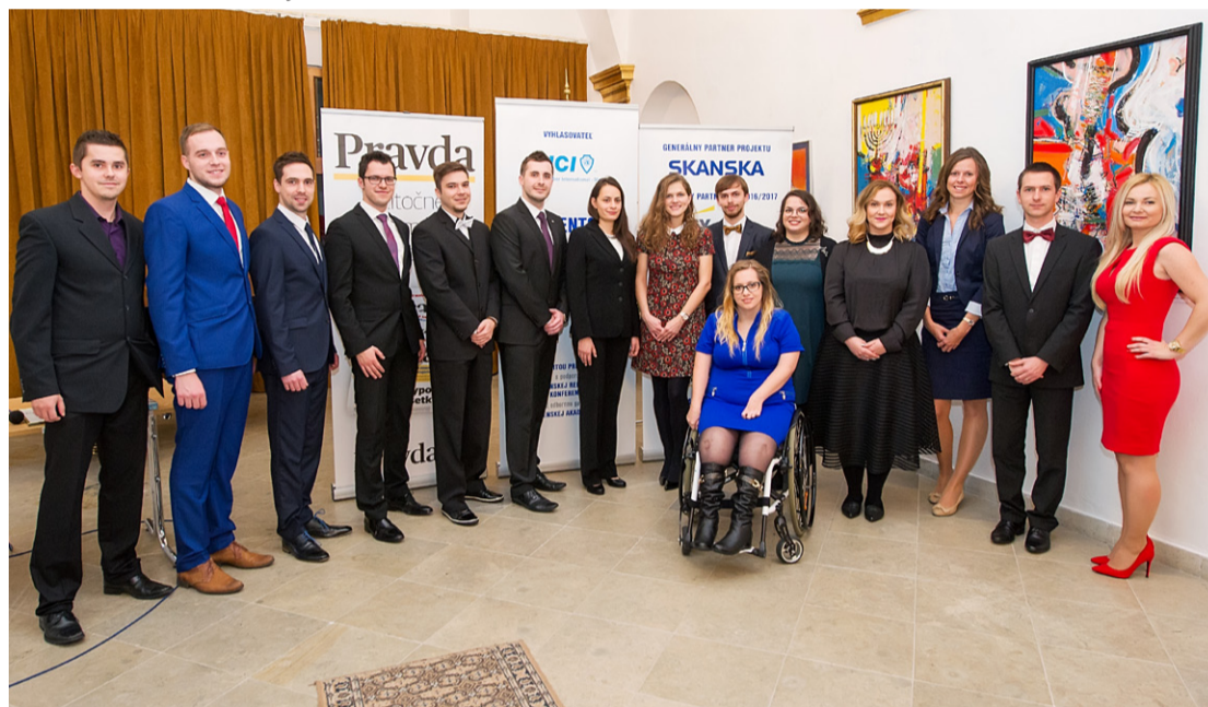
Víťazi jednotlivých kategórií ŠOS 2015/2016

V dvanástom ročníku ocenených vyberala odborná porota v dvanástich kategóriách, podľa študijného smeru. Vedenie fakúlt a riaditelia vedeckých pracovísk nominovali na ocenenie celkovo 79 študentov. Víťazi získali vecné ceny a finančnú odmenu.