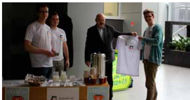
Svojou návštevou nás poctil aj pán rektor

prijímania. Na zahraničných univerzitách sa študenti hrdo hlásia k svojej alma mater, a to počas, ale aj po ukončení štúdia. Podobné myslenie by Študentská rada TU formovala medzi študentmi našej univerzity. Veríme, že to dosiahneme aj takými krokmi, ako je vydávanie študentského časopisu, v ktorom by sme chceli študentom priblížiť dianie na fakultách a celej univerzite. Súčasťou študentského časopisu budú tematické články od študentov jednotlivých fakúlt, prinesieme rozhovory so zaujímavými absolventmi, ale taktiež so súčasnými talentovanými študentmi či s našimi pedagógmi. V časopise nájde čitateľ zaujímavé články týkajúce sa histórie Trnavskej univerzity. V rámci myšlienky budovanie občianskej spoločnosti sa v časopise dočítate o orgánoch academickej samosprávy na našej univerzite, ale aj na celom Slovensku. Významnú časť každého vydania poskytneme umeleckej tvorbe našich študentov, či už pôjde o fotografie, maľby, poéziu alebo prózu.