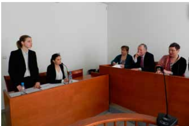
Medzinárodný simulovaný súdny spor v azylovom práve