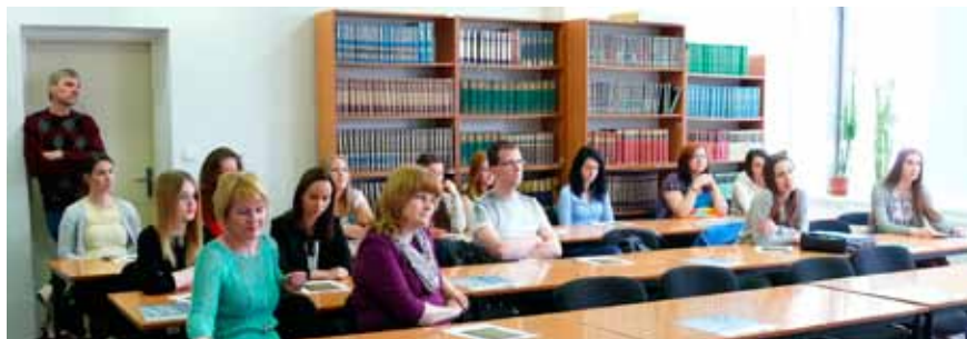
Študenti – účastníci vyhodnotenia súťaže Fejtón 2016

A čo bolo témou súťažných fejtónov? Ponúkame ich názvy: Všade dobre, na Slovensku najhoršie; Kolotoč kecov náš každodenný; Najdôležitejší človek môjho života; Zrkadlo; Svít student lajť alebo Ako dospieť (aspoň) v 35-ke; Moja mama mi hovorila: „Krásna si celá.“; Ja nie som hrdina; Ohavná krásna;