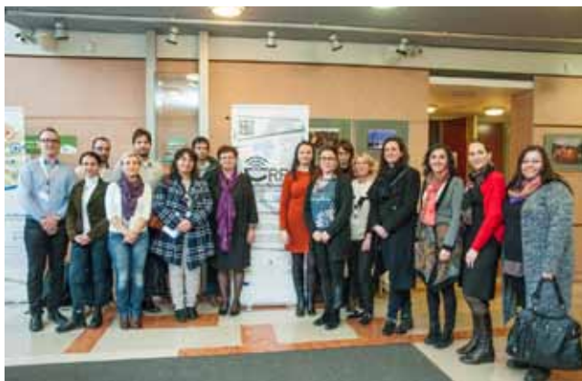
Účastníci konferencie v Doljenských Topliciach v Slovinsku

S cieľom uľahčiť čitateľom výmenu skúseností boli všetky prezentácie, ktoré sú dostupné na platforme