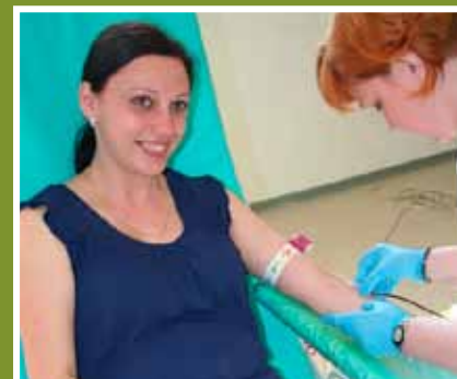
Jarnú kvapku krvi odovzdalo 70 darcov