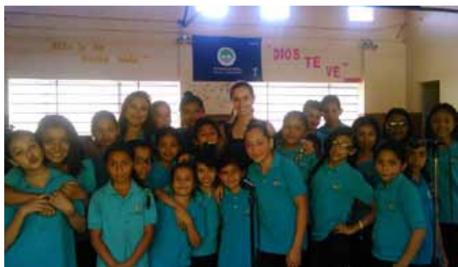
Škola Oratorio Don Bosco