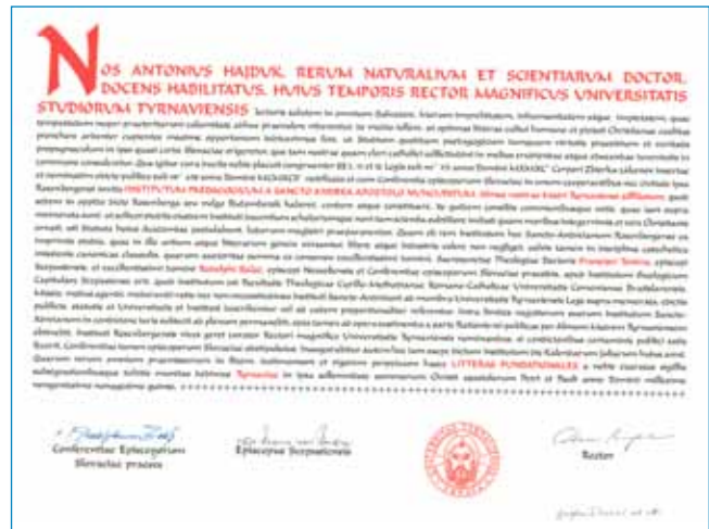
Zakladacia listina Pedagogického inštitútu sv. Ondreja pri Trnavskej univerzite so sídlom v Ružomberku