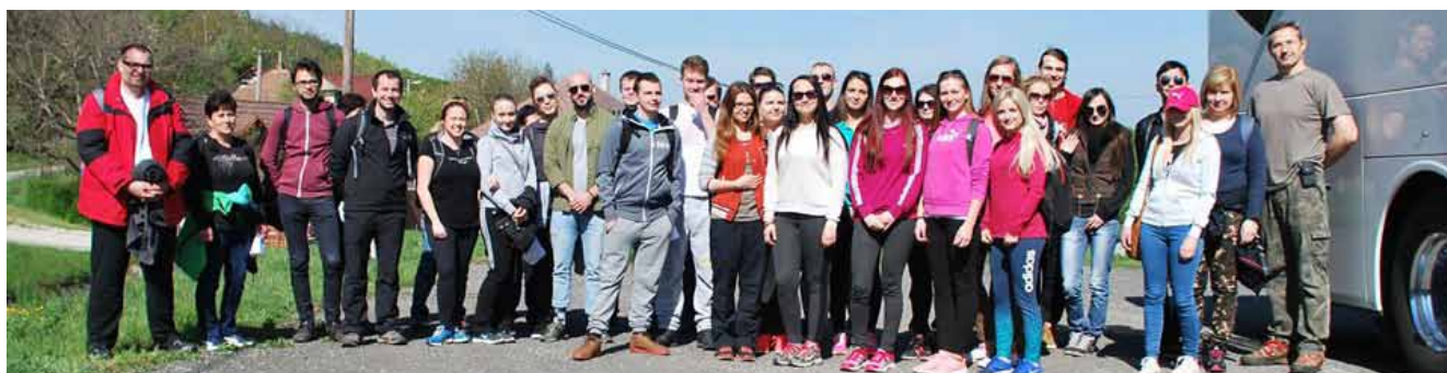
Účastníci brigády na Plaveckom hrade.