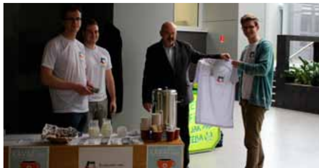
Svojou návštevou nás poctil aj pán rektor

prijímania. Na zahraničných univerzitách sa študenti hrdo hlásia k svojej alma mater, a to počas, ale aj po ukončení štúdia. Podobné myslenie by Študentská rada TU formovala medzi študentmi našej univerzity. Veríme, že to dosiahneme aj takými krokmi, ako je vydávanie študentského časopisu, v ktorom by sme chceli študentom priblížiť dianie na fakultách a celej univerzite. Súčasťou študentského časopisu budú tematické články od študentov jednotlivých fakúlt, prinesieme rozhovory so zaujímavými absolventmi, ale taktiež so súčasnými talentovanými študentmi či s našimi pedagógmi. V časopise nájde čitateľ zaujímavé články týkajúce sa histórie Trnavskej univerzity. V rámci myšlienky budovanie občianskej spoločnosti sa v časopise dočítate o orgánoch academickej samosprávy na našej univerzite, ale aj na celom Slovensku. Významnú časť každého vydania poskytneme umeleckej tvorbe našich študentov, či už pôjde o fotografie, maľby, poéziu alebo prózu.