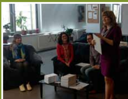
Vyhodnotili súťaž Študentský fejton 2016