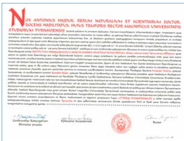
Zakladacia listina Pedagogického inštitútu sv. Ondreja pri Trnavskej univerzite so sídlom v Ružomberku