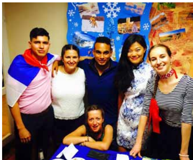
Medzinárodný deň, keď sme reprezentovali svoje krajiny (vpravo autorka článku)

vyšívania u toho člena, ktorý ponúka to, čo hľadám pre svoj osobný rozvoj. Projekt dodnes funguje, generácia dobrovoľníkov z rôznych krajín sveta usporadúva každý mesiac online meeting , kde konzultujeme projekt ako taký, „rokuje“ o vylepšeniach, zdieľame nápady i kritiku. V súčasnosti uvažujeme nad vytvorením „Banky času“ aj na území Slovenskej republiky (v niektorých krajinách už funguje, napr. v Taliansku, Mexiku...).